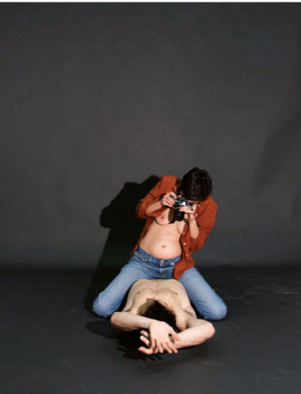
Benoit Pradier / Photographie 2011

Lors du vernissage le 21 mars, la Revue Laura est porteuse du projet d'exposition dans l'espace de la chapelle Saint-Libert. En octobre 2019, un portfolio de l'édition sera présent dans les pages de la revue #27.