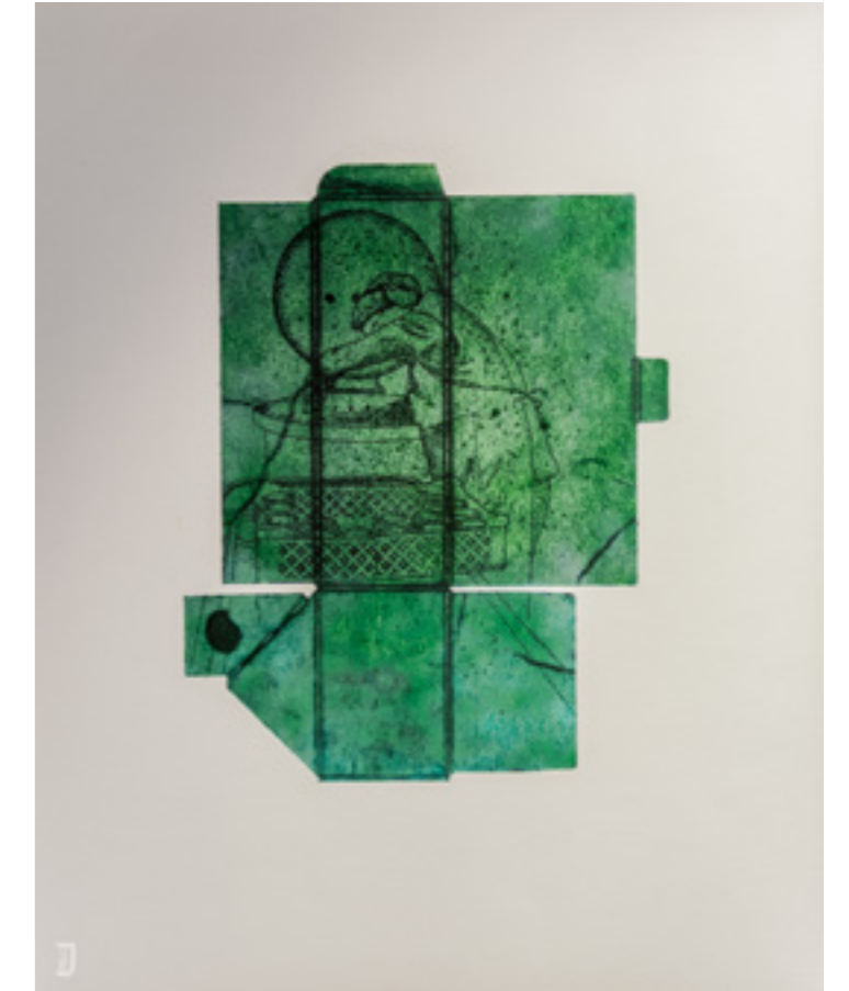
Lou Mudjou , gravure, pointe sèche sur emballage de la conserverie Lou Mudjou , 40 x 50 cm, acquisition de la Ville de Port de Bouc, 2019 © Julien Lamarre

www.immediats.fr/felix-pinquier-et-marie-noelle-deverre-offshore-quai-main-grue