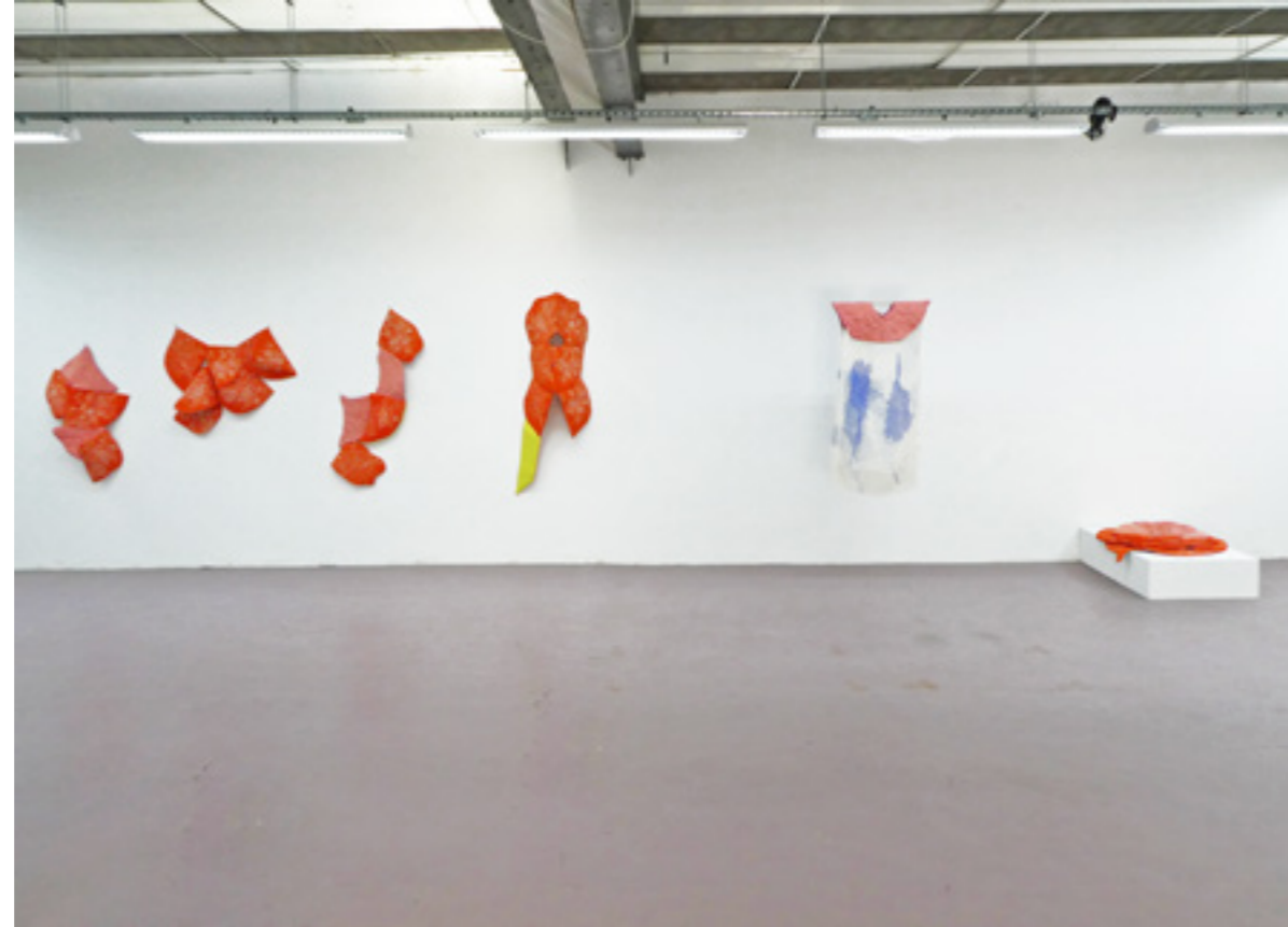
Vue de l'exposition De fil en 4 , installation évolutive, linogravures gaufrées, imprimées sur drap et cousues, dessins de couture sur soie rembourrée, dimensions variables, commissariat Jean-Marc Revy (Galerie du 116Art ), La Fabrique des Colombes, Biennale de Lyon en Résonance , 2022