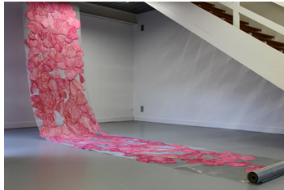
Le bout du rouleau , détail, installation évolutive et expansive, gravure au dépron inspirées de planches éducatives, estampes découpées, rouleau de gaze de métal, épingles, galerie Duchamp, Iconoclasses XX , 2018 © Jade PSQ

L'installation Le bout du rouleau puise dans cette banque d'images anciennes pour remuer le fond de nos idées reçues ou images d'Épinal. Dans cette installation, en forme de plan de dissection monumental, la couleur rose chair des estampes met au même niveau toutes ces choses (vues en coupes, schémas, du corps humain, de faune et de flore marine et terrestre) qui se déversent en cascade comme d'une Corne d'abondance.