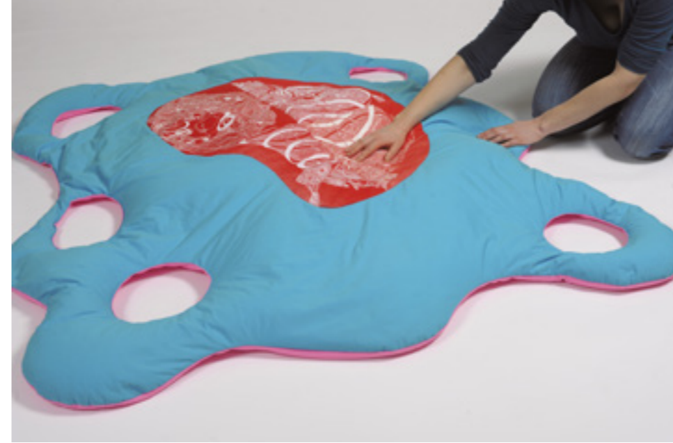
Indice incertain sculpture textile évolutive, résidence C.H.U. d'Angers en 2015