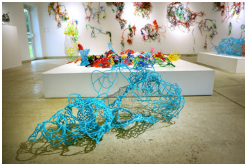
Cura pipa , sculptures en cure-pipe, dimensions variables, vue d'exposition personnelle à La Corne d'Or, 2016