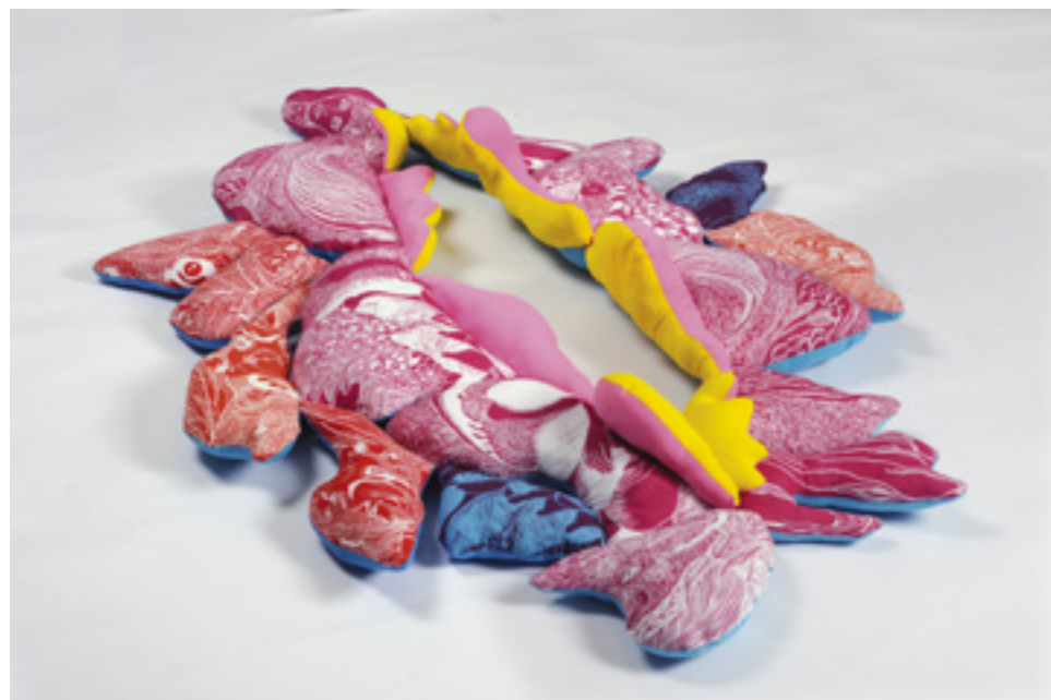
Gestatio , sculpture textile évolutive, résidence C.H.U. d'Angers en 2015