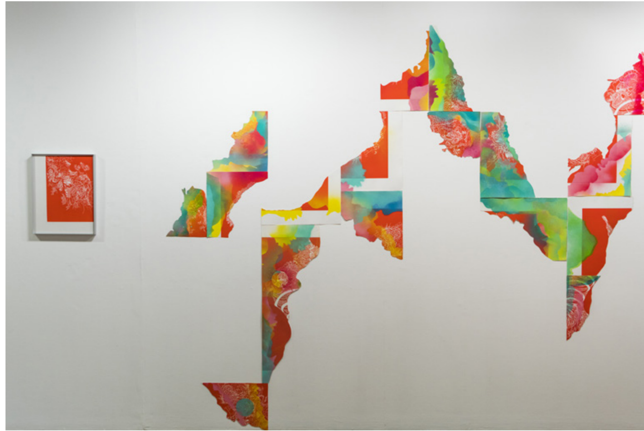
Les restes du jour , installation évolutive, linogravures découpées, bombe acrylique, techniques mixtes, linogravure encadrée, exposition Métamorphoses et Débordements , Maison des Arts Solange-Baudoux, 2021 © Vincent Connétable