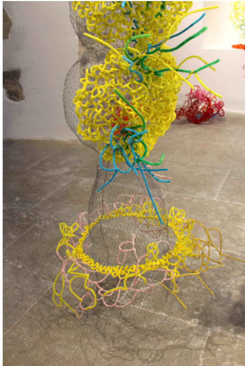
Cura pipa , installation évolutive, détail