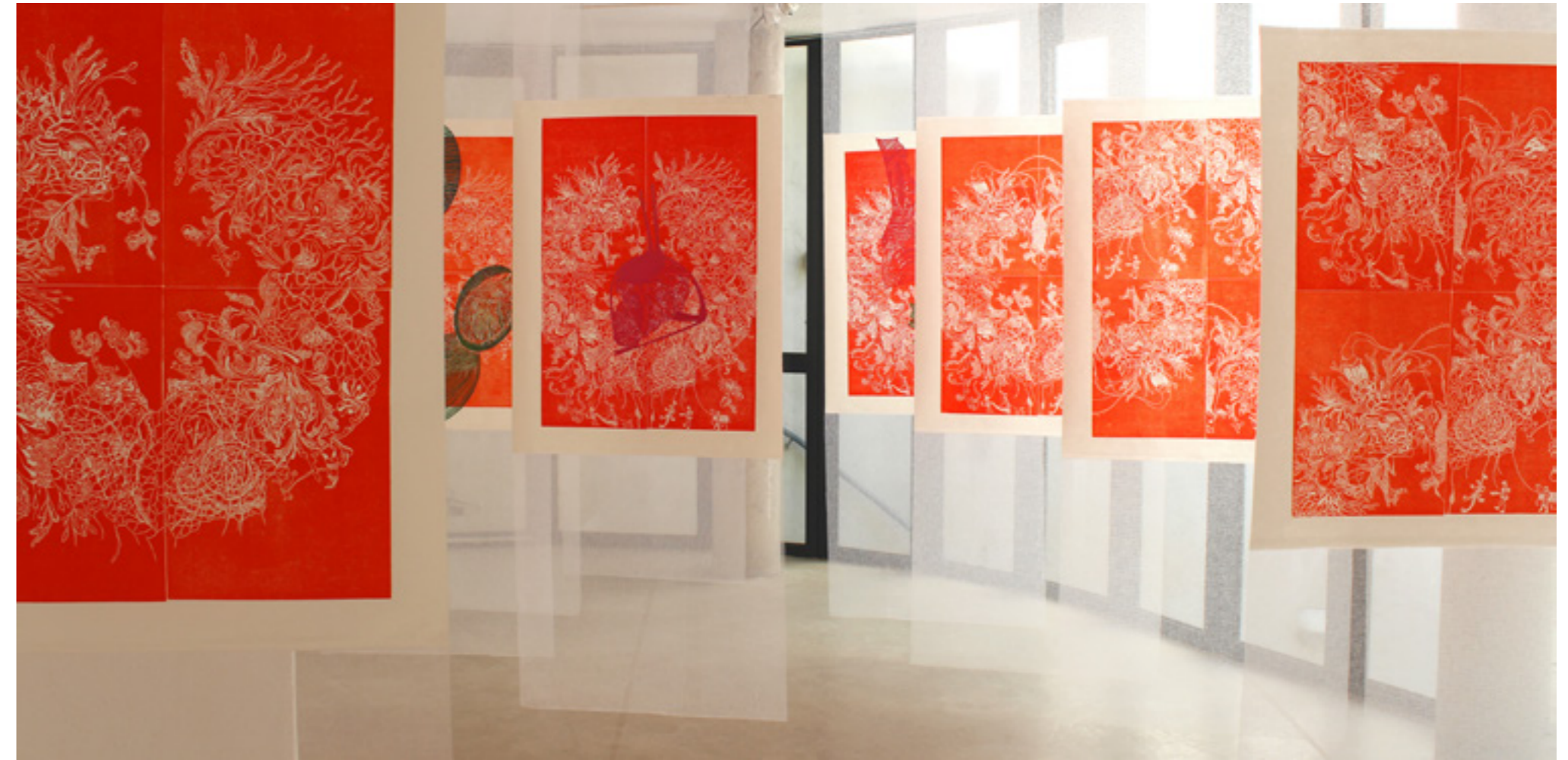
Cool over , installation d'estampes, linogravure sur papier de riz, estampage de gravure au dépron par superposition, Maison de la Tour- Le Cube, 2018

Cette série a été réalisée en résidence de création à l'Hôpital d'Argentan en partenariat avec la Maison des Dentelles, dans le cadre du programme Culture-Santé (avec le soutien de la Ville d'Argentan, de la Région, de la D.R.A.C Normandie, de l'A.R.S de Normandie). Quelques unes de ces photographies font partie des collections de l'Artothèque L'Inventaire.