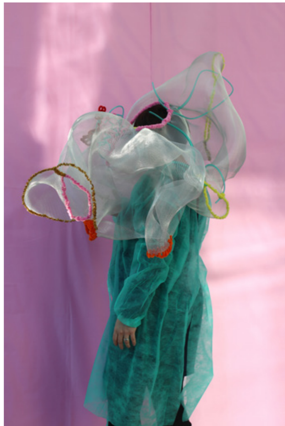
Dans ta peau , série de photographies-performances avec des blouses jetables, des sculptures portables en gaze de métal et cure-pipe, 2017