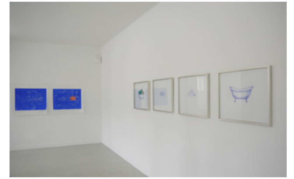
Images liquides , dessins, céramiques, estampes, exposition dans le cadre d'un Jumelage de création partagée avec le collège Louise Michel et le Centre d'Art Contemporain Les Bains-Douches, avec le soutien de la DRAC Normandie et le Conseil Départemental de l'Orne, Les Bains-Douches, Alençon, 2019