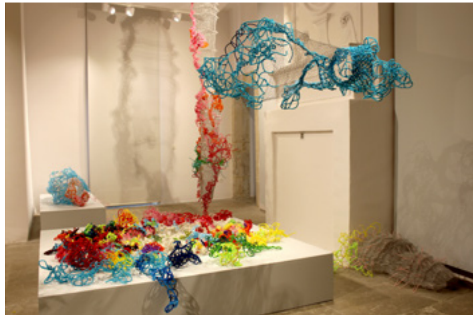
Cura pipa , installation évolutive, exposition collective L'extraordinaire de l'ordinaire , Maison des Consuls, Musée d'art et d'archéologie, Les Matelles (Ocitanie), avec Les Vendémiaires, 2018