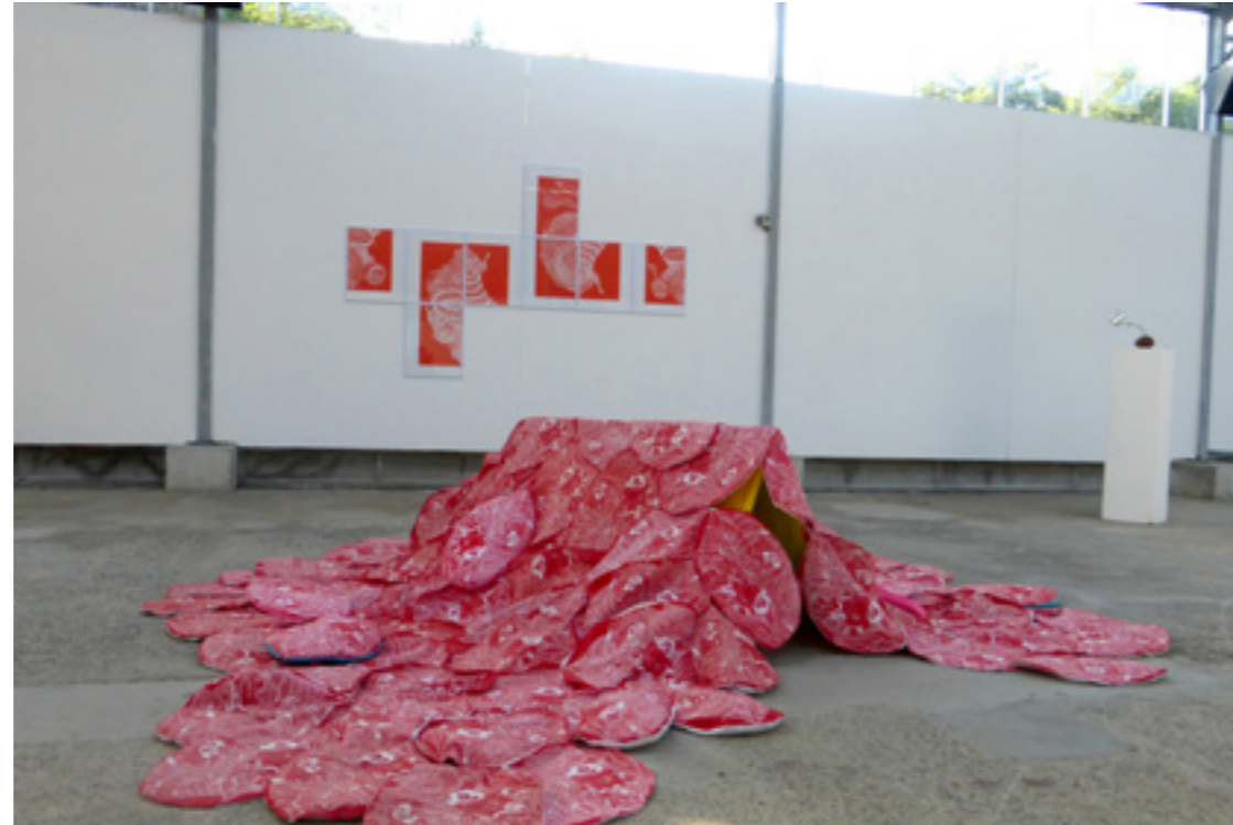
A mon seul désir, sculpture évolutive 2013- 2017, impressions de linogravures et tissus cousus, dimensions variables. Vue de l'exposition Intérieur/Extérieur, Usine Utopik, 2014

Une radiographie de dentelle m'a permis d'observer la matière, de fouiller le minuscule, l'imperceptible, grâce à mes gouges. Cette première gravure a donné naissance à puzzle aléatoire. Ces gravures, regroupées sous le nom de Nature variable , constituent un ensemble exponentiel dont les éléments se démultiplient comme dans un kaléidoscope, en vue de faire naître une infinité de possibles.