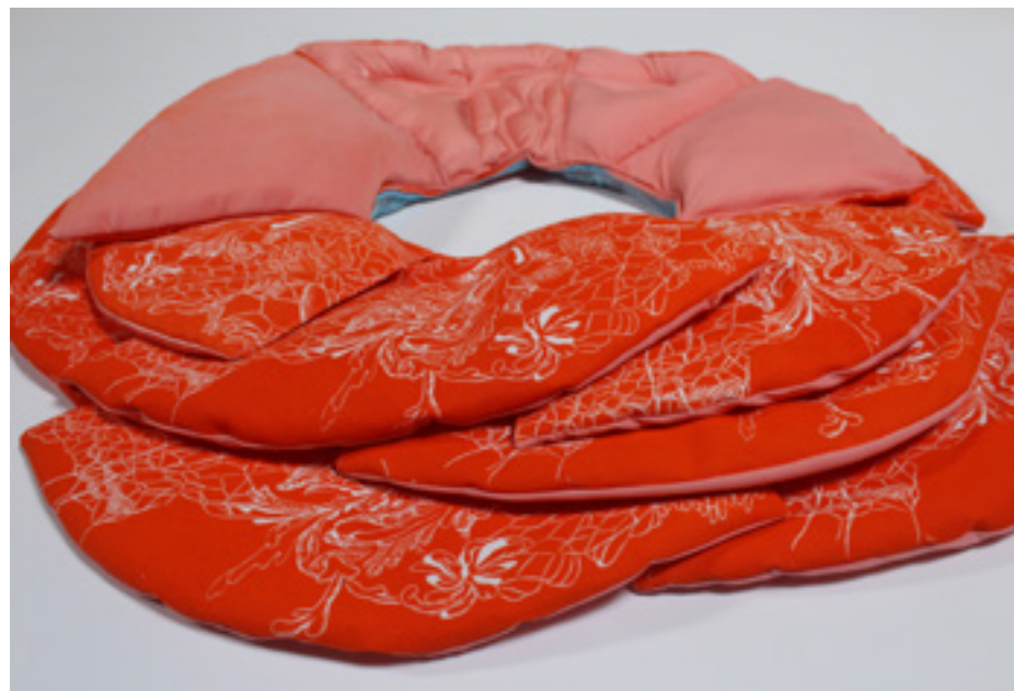
Col- Fraise, sculpture évolutive, dimensions variables, linogravures imprimées sur drap et cousues, soie rembourée, morceau de blouse de soignant, 2017-2022