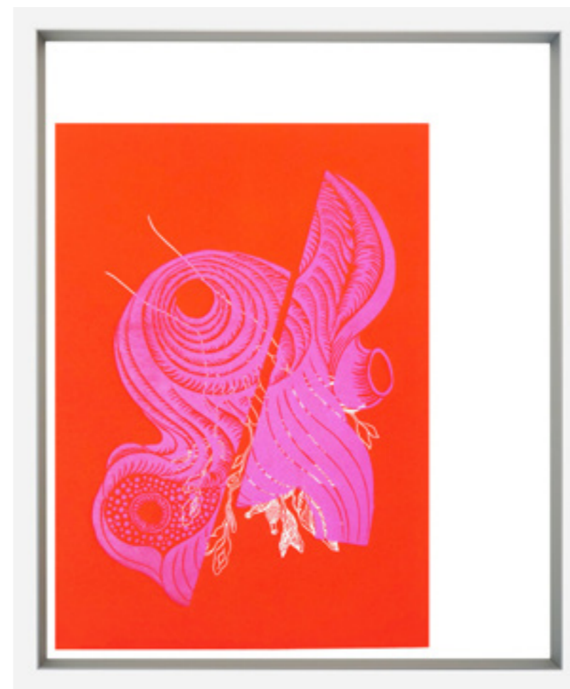
Amour divin , linogravure gaufrée, impression sur papier Hahnemühle, 50 x 40 cm, 2021