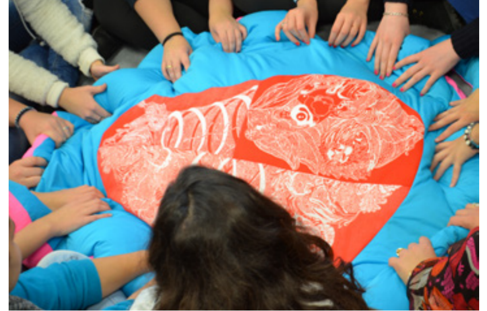
Indice incertain sculpture textile évolutive, résidence galerie In Situ en 2013 © Evelyne Pérard