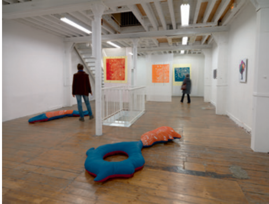
Bouge pour voir , vues d'exposition, Galerie Duchamp, 2016