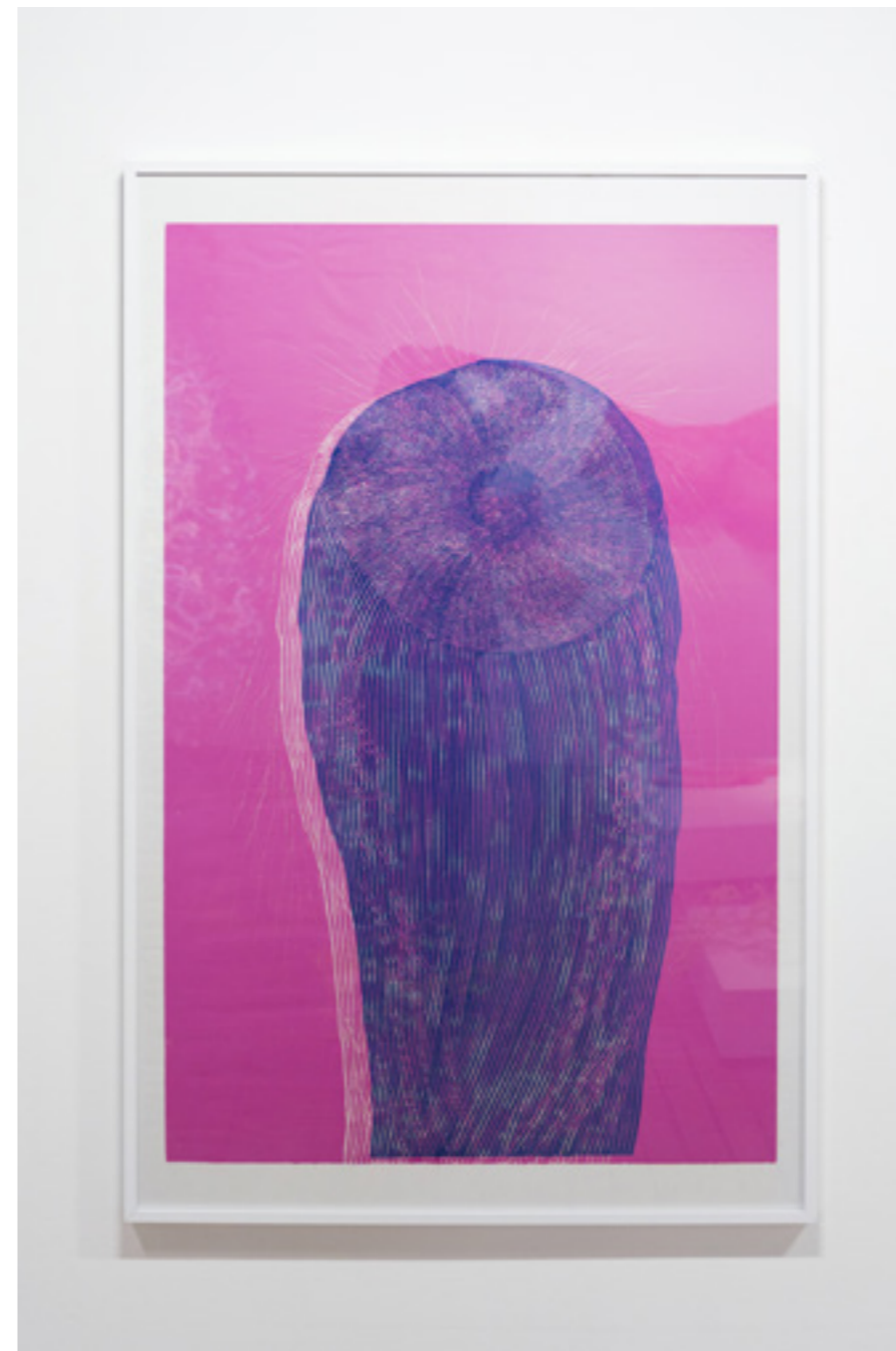
Porifera , gravure au scalpel dur dépron imprimée sur papier Kozo, inspirée d'une résidence en Roumanie, 140 x 90 cm, tirage unique, 2019 © Vincent Connétable