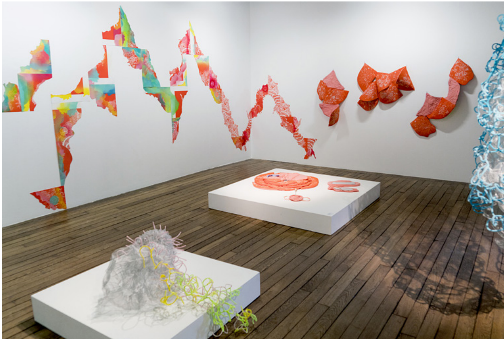
Vue de l'exposition Métamorphoses et Débordements , Maison des Arts Solange-Baudoux, 2021