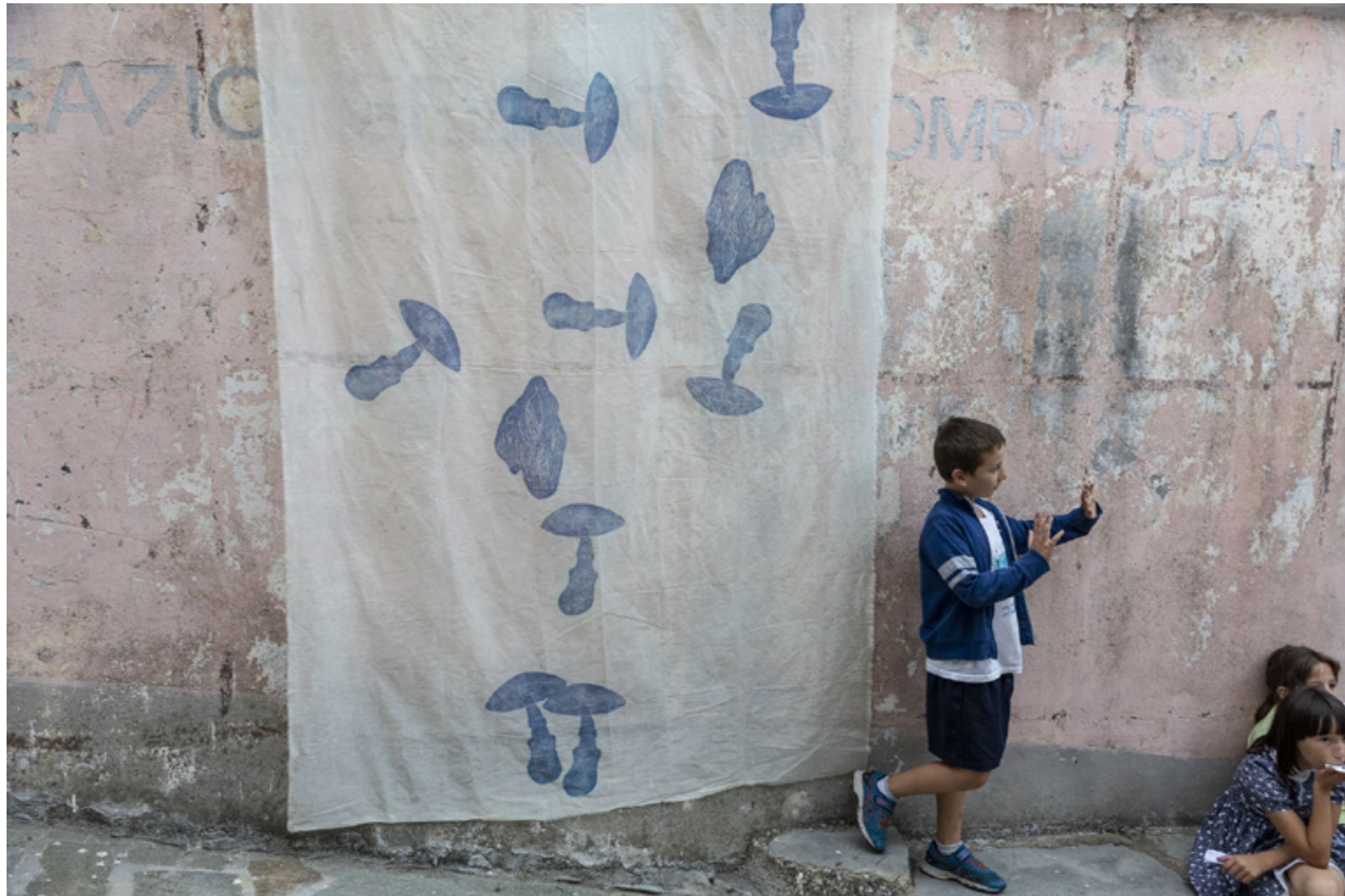
Les rideaux de John, installation, série évolutive inspirée de l'œuvre de John Cage, résidence Ad ognuno de la sua parte, Villatalla (Italie), 2019-2022