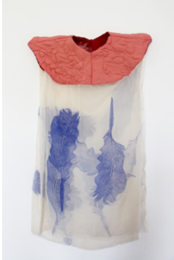
Attrape-mi , estampe sur voile de lin, linogravure imprimée sur drap, dessins de couture sur soie rembourrée, 80 x 120 cm environ, 2021