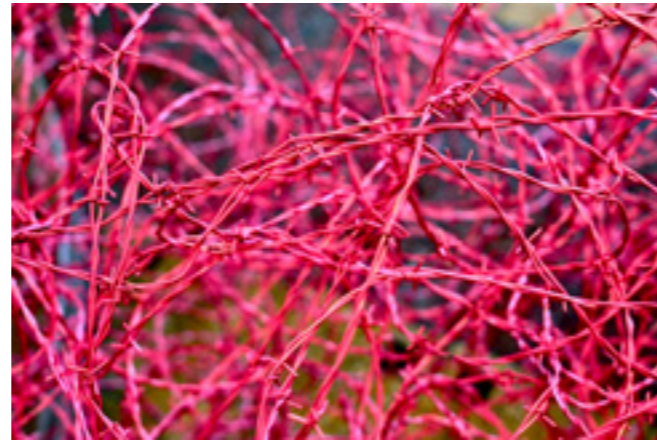
Entre là (détail installation), barbelés thermolaqués