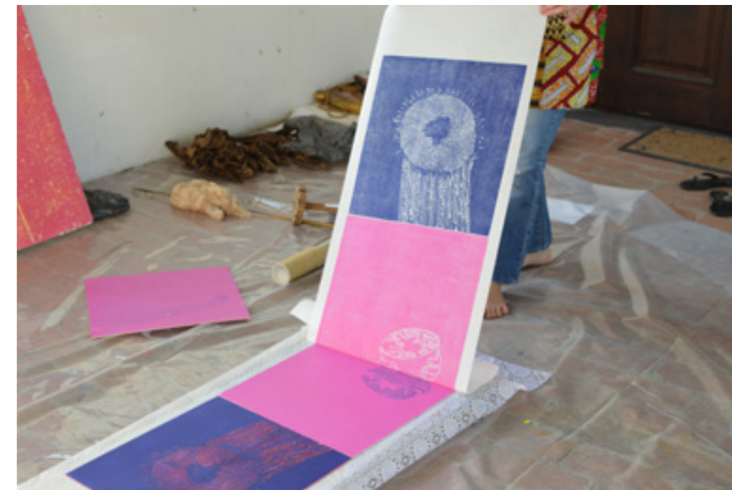
Résidence au Conașul Otelesisanu à l'invitation de Christian Parashiv, Benesti (Roumanie), suivie d'une exposition à la Galerie Romană, Bucarest, 2018