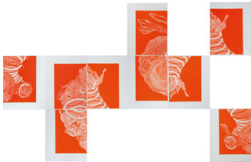
Nature variable , série exponentielle et évolutive de linogravures gaufrées (40 x 50 cm), impression sur papier Hahnemüle, 2015 © Alain Chudeau