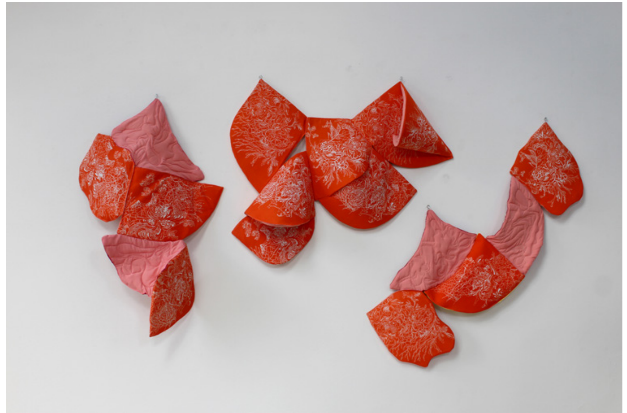
Variable , installation évolutive, linogravures imprimées sur drap et cousues, dessins de couture sur soie rembourrée, galerie Vertige, Bruxelles, 2019

Ces créations ont été initiées lors d'une résidence de création à l'Hôpital d'Argentan en partenariat avec la Maison des Dentelles, dans le cadre du programme Culture-Santé avec le soutien de la Ville d'Argentan, de la Région Normandie, de la D.R.A.C Normandie, de l'A.R.S de Normandie.