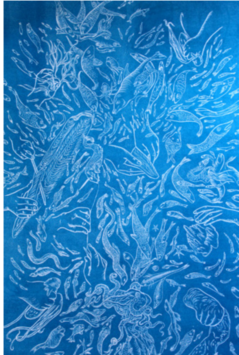
Quai Main Tri , détail d'estampe, 90 x 140 cm, gravure au scalpel sur dépron, impression sur papier Kozo, tirage unique, 2019