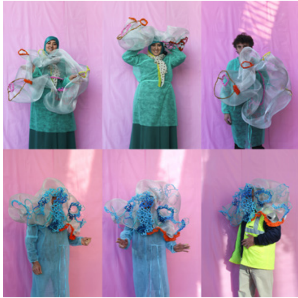
Dans ta peau , série de photographies-performances avec des blouses jetables, des sculptures portables en gaze de métal et cure-pipe, 2017

Lors d'une performance en milieu hospitalier, j'ai proposé à des patients, des soignants et des visiteurs de choisir une des sculptures que j'avais créée lors de ma résidence à l'hôpital, puis de la porter sur leur corps, de la manière qu'ils le souhaitaient. La seule contrainte était de revêtir un habit commun : une blouse jetable d'hôpital, bleue ou verte, translucide, qui laissait plus ou moins apparaître les vêtements portés en dessous. Ainsi patients, soignants et visiteurs ont partagé la même peau en portant une blouse jetable telle une mue, et en se transmettant les sculptures. Chaque personne s'est naturellement mise elle-même en scène, tout en jouant. J'observais et photographiais les gestes qui échappaient à la maîtrise de soi lors de ce léger abandon. J'ai cherché à saisir une part de ce lâcher-prise.