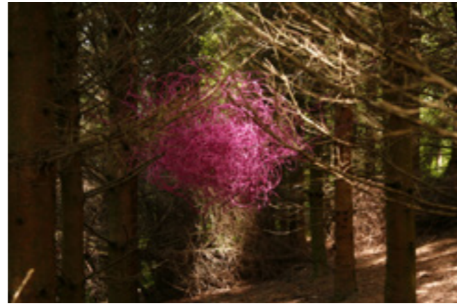
La forêt folâtre , installation, bois de La Ribardière, avec vAertigo dans le cadre de ArtTerritoire , Athis de l'Orne, 2013